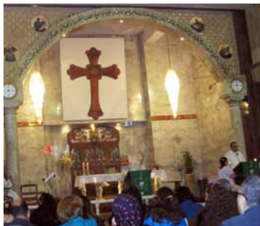
Kerk in Syrië

De actie is geslaagd als er in de kerken, bij de bevolking en bij de politiek (meer) betrokkenheid ontstaat bij de situatie van christenen en andere kwetsbare minderheden in Irak en Syrië; en als christenen en andere kwetsbare minderheden in die landen aan den lijve ervaren dat mensen elders in de wereld voor hen bidden en voor hun rechten opkomen.