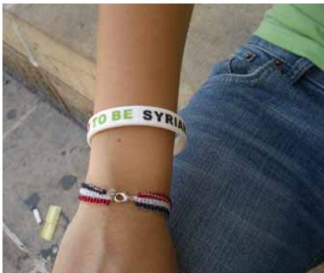
'Proud to be Syrian'

In MissieNederland en de Raad van Kerken zijn netwerken ontstaan van initiatieven in opvang van en bemiddeling voor de vluchtelingen in Nederland. MissieNederland en de Raad van Kerken hebben speciale website-onderdelen gecreëerd waarop diverse initiatieven omtrent de opvang van asielzoekers staan ( http://www.missienederland.nl/vluchteling ; en http://www.raadvankerken.nl/pagina/1474/vluchtelingen ). De sites zijn bedoeld ter informatie, inspiratie en afstemming voor kerken en organisaties overal in Nederland.